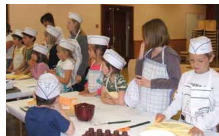
Je cuisine avec maman : réalisation de croissants aux chocolats à Esprels