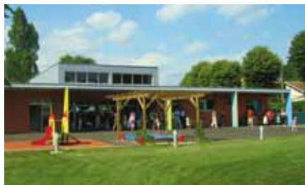
Le multi-accueil de Villersexel bénéficiera d'une cuisine et d'une pièce de jeux supplémentaire.