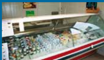
→ Ferme de la fontaine à Mollans