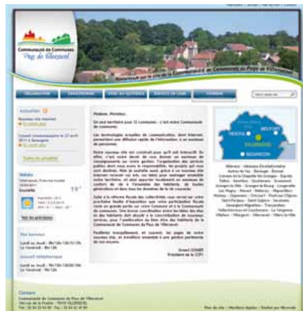
Une nouvelle charte graphique pour le site Internet de la CCPV

Entreprises : www.cc-villersexel.fr Rubrique Entreprendre / Les entreprises