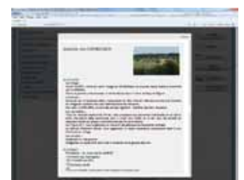
Une fiche détaillée des annuaires