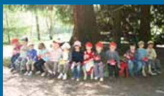
→ L'arboretum de la Cude