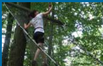
→ Accro'cimes à Montbozon