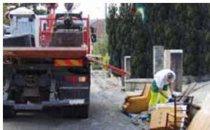
Collecte des encombrants 2010

Les matériaux volumineux collectés sont identiques à ceux acceptés en déchetterie. Un doute, une question ? contactez le SICTOM !!!