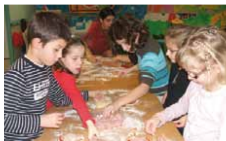
Activité culinaire : j'apprends à faire une pizza à Esprels

Les inscriptions sont possibles tout au long de l'année, pour les enfants scolarisés de 3 à 11 ans.