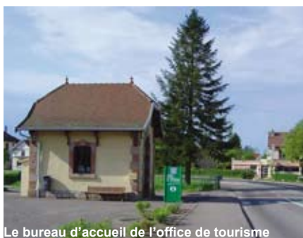
Le bureau d'accueil de l'office de tourisme