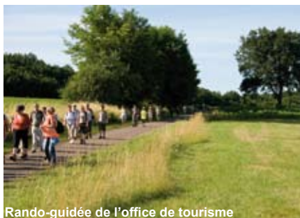
Rando-guidée de l'office de tourisme