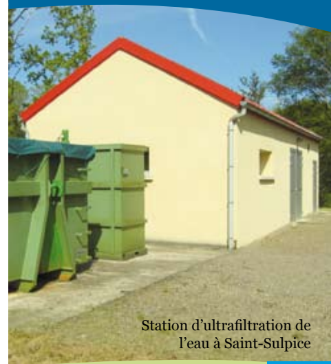
Station d'ultrafiltration de l'eau à Saint-Sulpice