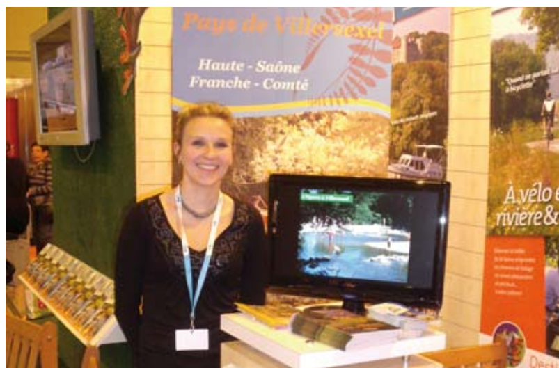
Notre espace sur le stand de Destination 70 au salon de Colmar 2011