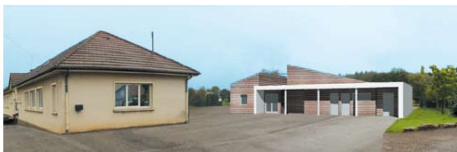
Insertion paysagère du bâtiment périscolaire d'Athesans par rapport à l'école actuelle.

Le centre périscolaire aura une capacité d'accueil de 60 enfants. L'ouverture de ce dernier est prévue pour l'automne 2013. Dans un premier temps, il fonctionnera uniquement durant les périodes scolaires. Cependant, la Communauté de Communes du Pays de Villersexel envisagera une ouverture hors période scolaire en fonction de la demande.