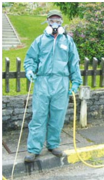
Une tenue de sécurité adéquate est indispensable pour certains travaux (ici du desherbage).