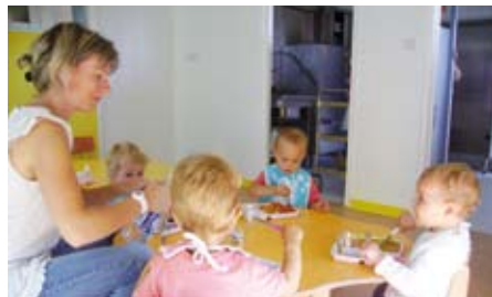
Le nouveau coin repas où les enfants découvrent des goûts et des saveurs variés.

Les enfants disposent d'un nouveau coin repas et d'une nouvelle pièce de vie.