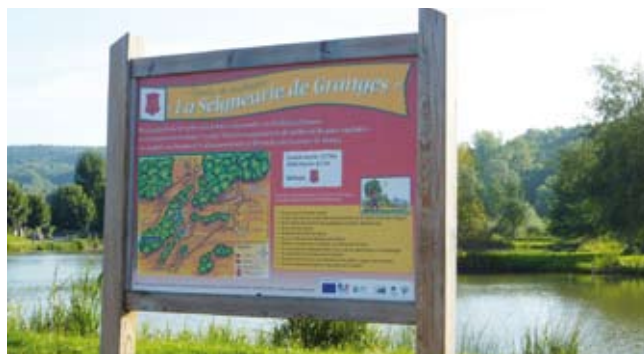
Départ du sentier de randonnée de la Seigneurie de Granges

Au cœur du village se trouve un étang où la pêche est autorisée par la société de pêche La Valoise, les week-ends, jours fériés et pendant le mois d'août. Un concours de pêche s'y déroule tous les ans, durant la 1 ère semaine de mai. Le départ du sentier de randonnée de la Seigneurie de Granges se situe près de